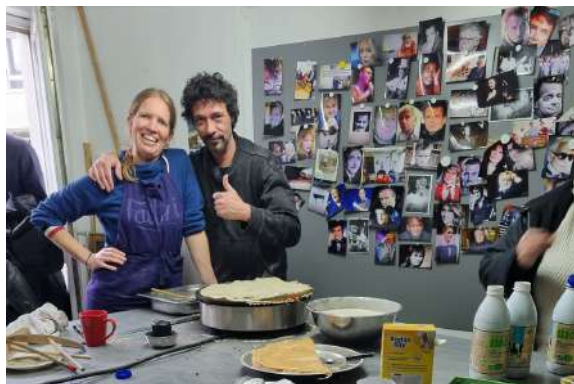
Chandeleur au café !