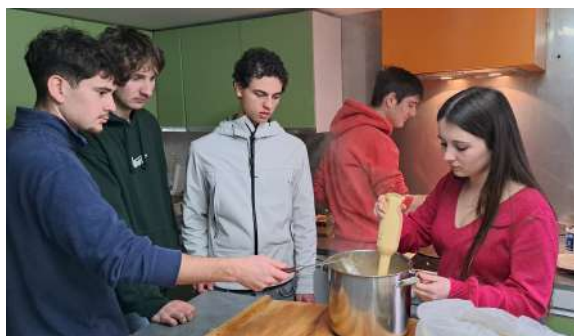
Soupe avec les étudiants de l'ICAM